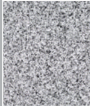
طبقة مركبة أساسية ومقاومة للتجمد