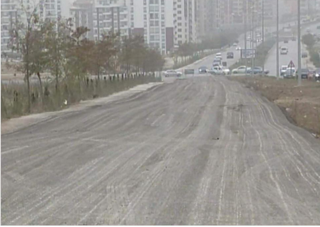
NovoCrete® uygulamasından 2 yıl sonraki yolun görünümü- 24.11.2014